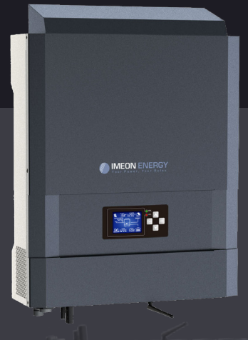
IMEON 3.6 Jusqu'à 4kWp Monophasé