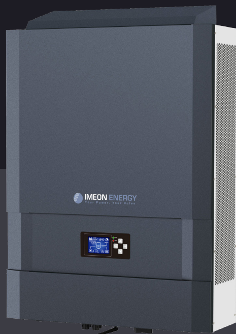
IMEON 9.12 Jusqu'à 12kWp Triphasé