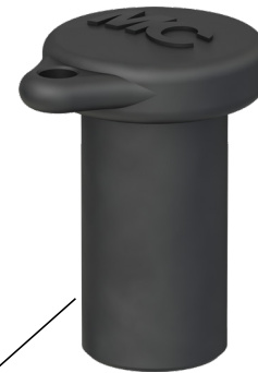
Bouchon de protection pour prise femelle Sealing cap for female cable coupler