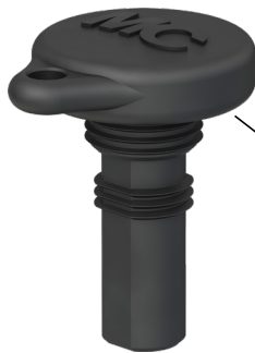
Bouchon de protection pour prise mâle Sealing cap for male cable coupler